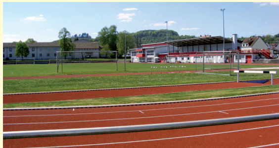
Beispiel Sportplatz: Hier wurden 330.000 Euro für die Erneuerung der Laufbahn investiert.

Der größte Teil der Summe floss in die Erhaltung der Sportstätten (Sanierung Kultur- und Sporthalle, Erneuerung der Laufbahn im Bungertstadion), die Bildung und Betreuung (Kauf eines Gebäudes für die Grundschule, Ausbau von Betreuungsplätzen), die Ausstattung der Feuerwehr sowie die Dorfinfrastruktur.