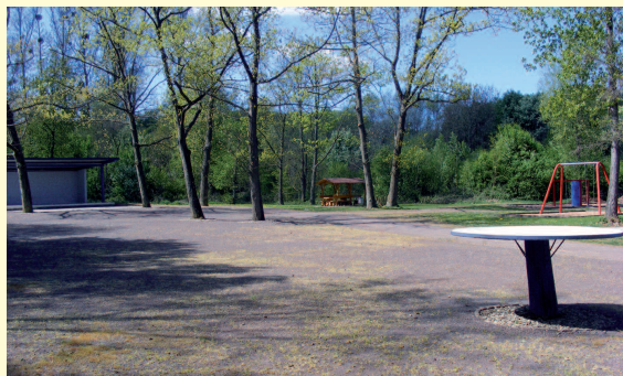
Beispiel Festplatz Rohrwald: Kleine Investition – großartige Arbeit – Ein Dank an die Vereine, Unterstützer und vielen ehrenamtlichen Helfer für die geleistete Arbeit