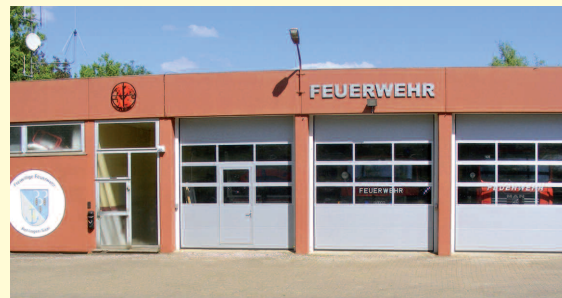
Beispiel Feuerwehr: Hier wurden über 300.000 Euro für die Anschaffung eines Löschfahrzeuges und die Sanierung des Feuerwehrgerätehauses investiert