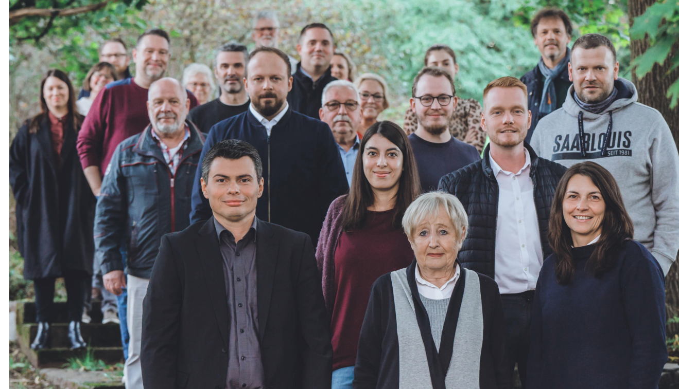
Neuer Vorstand des SPD-Stadtverbands Saarouis. Alle Vorstandsmitglieder mit ihren Funktionen finden Sie auch unter: www.sv-saarouis.spd-saar.de