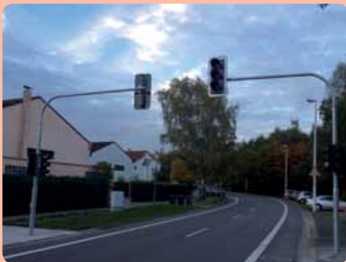
Neue Ampelanlage Kurt-Schumacher-Allee und Konrad-Adenauer-Allee