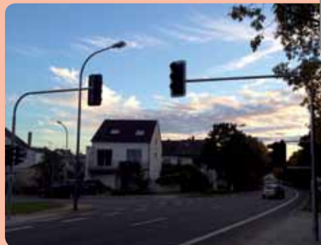
Neue Straßenmarkierung, hier in die Einfahrt der Karthäuserstraße